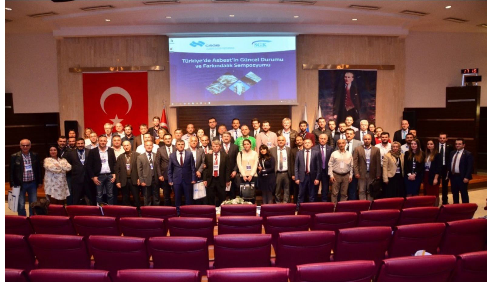
Asbest söküm uzmanlığı eğitimleri, İSGÜM tarafından verilmektedir.

Solunum yoluyla maruz kalındığında kanserojen olan asbest, yalıtım amacıyla dünyada sıkça kullanılırken sağlığa zararlarının anlaşılmasından sonra, başka kimyasallarla ikame edilmeye başlanmış, ticareti Türkiye'nin de dahil olduğu birçok ülkede yasaklanmıştır. Eski gemilerin sökümü, binaların yıkımı vb. işlemler sırasında tekrar ortaya çıkmaktadır.