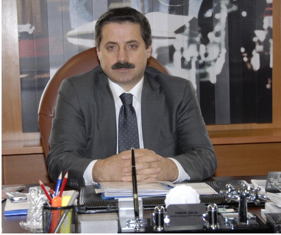
Faruk ÇELİK Çalışma ve Sosyal Güvenlik Bakanı