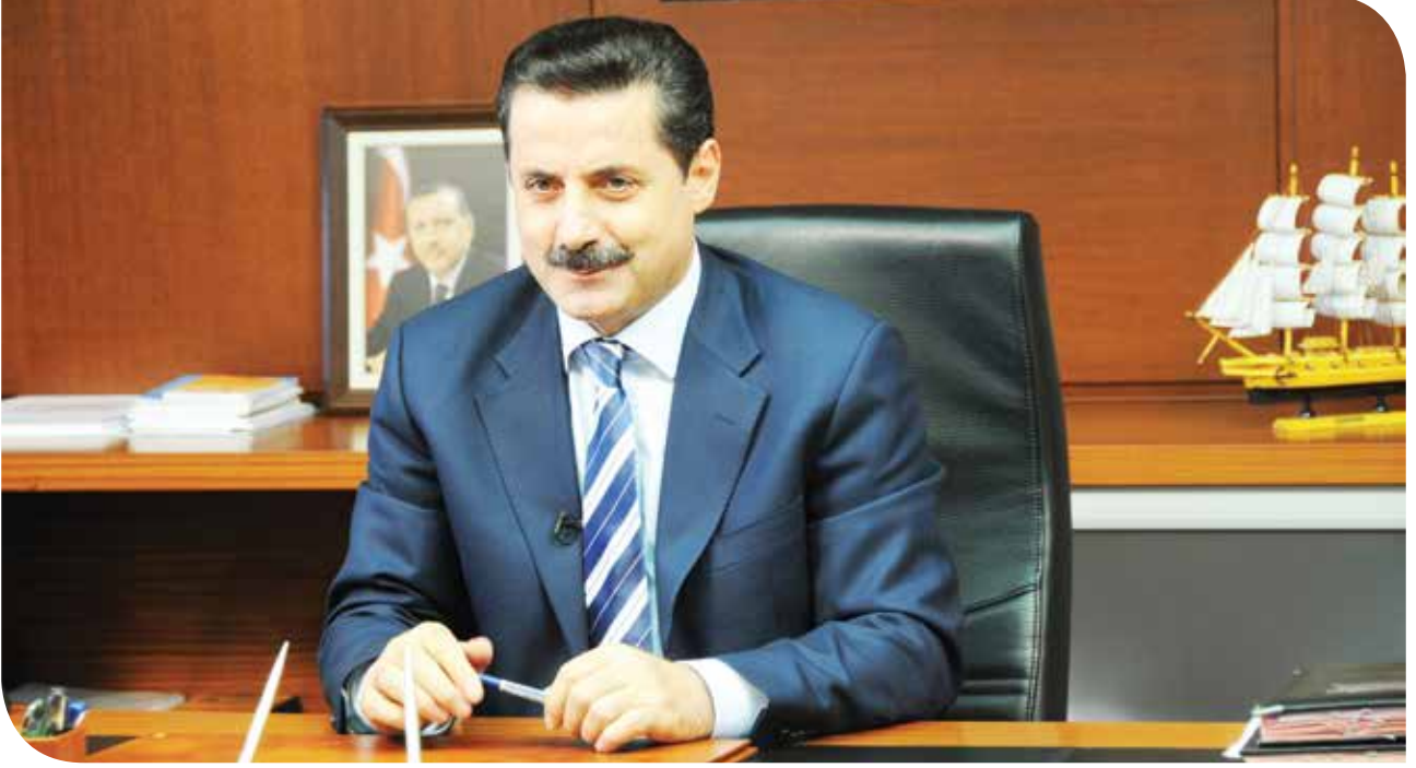
FARUK ÇELİK Çalışma ve Sosyal Güvenlik Bakanı