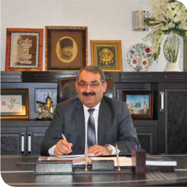
HALİL ETYEMEZ Bakan Yardımcısı